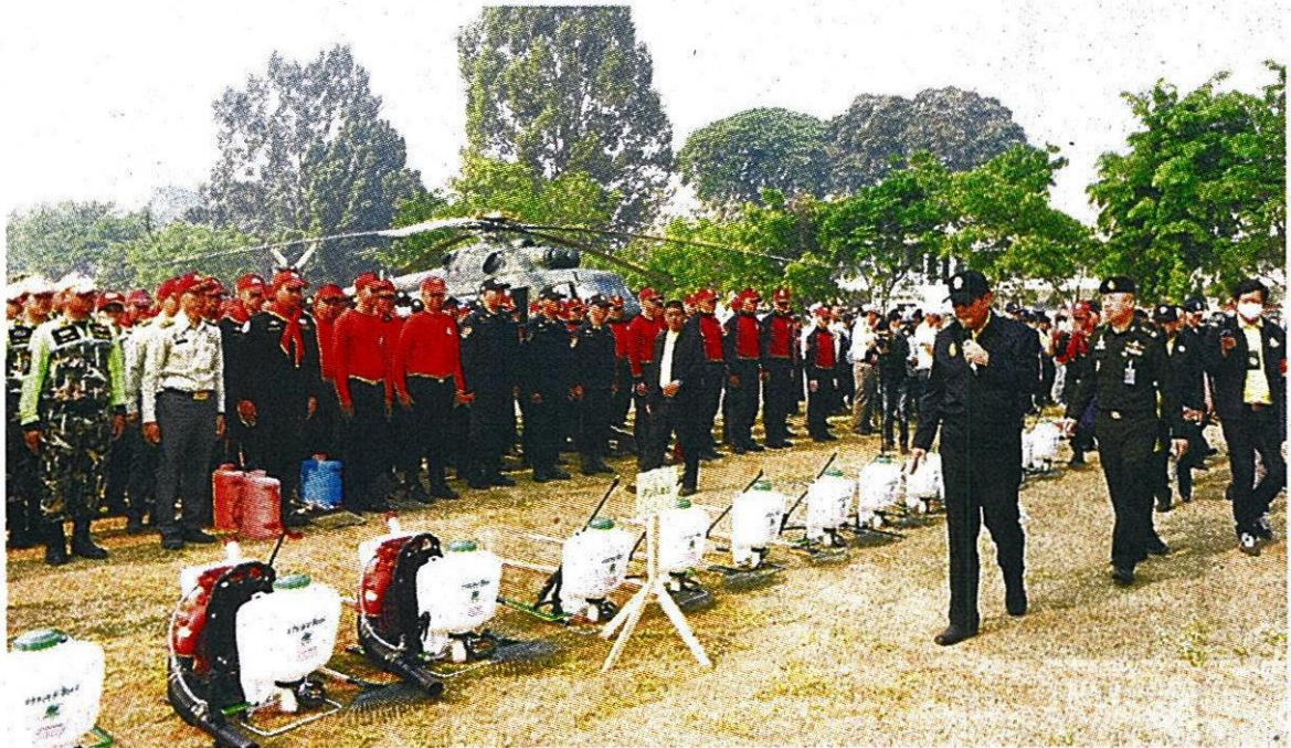
แก้หมอกควัน : พล.อ.ประยุทธ์ จันทร์โอชา นายกรัฐมนตรี พร้อมคณะ ลงพื้นที่จ.เชียงใหม่ เพื่อตรวจเยี่ยมกองบัญชาการควบคุมสถานการณ์หมอกควัน กองทัพภาคที่ 3 ส่วนหน้าและส่งมอบอุปกรณ์สนับสนุนการปฏิบัติงาน วานนี้(2 เม.ย.)