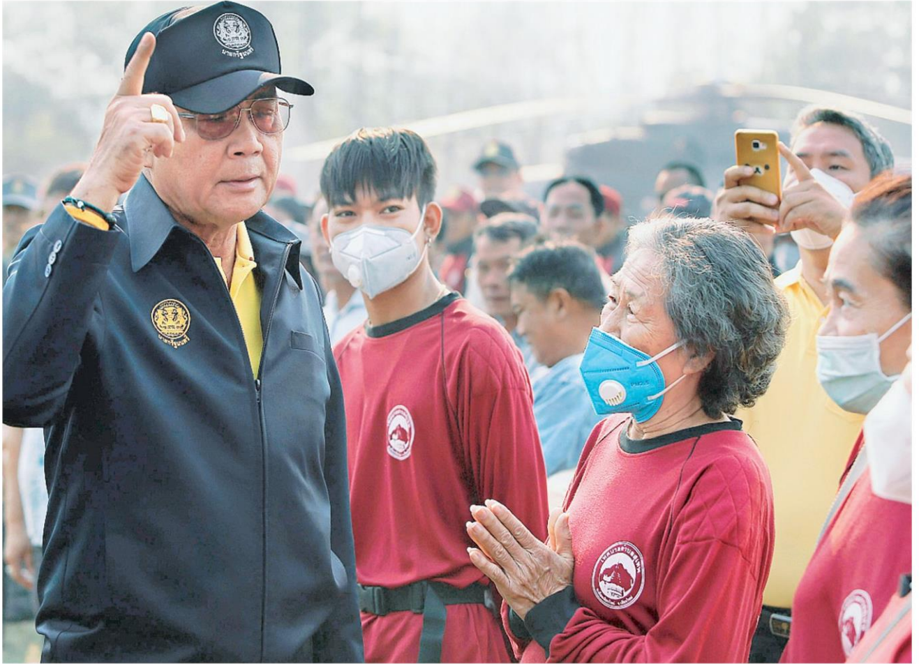
แก้ควีนพิษ พล.อ.ประยุทธ์ จันทร์โอชา นายกรัฐมนตรี และหัวหน้า คสช. ทักทายชาวบ้านระหว่างไปประชุมติดตามสถานการณ์แก้ไขปัญหาวิกฤติหมอกควีนและไฟป่าที่ปกคลุมภาคเหนือ ที่อาคารอเนกประสงค์ ธนาคารแห่งประเทศไทย สำนักงานภาคเหนือ อ.เมืองเชียงใหม่ จีให้รู้ผลใน 7 วัน.

จากหมอกควีนจากไฟป่าจนมีผู้ป่วยตามโรงพยาบาลต่างๆเพิ่มขึ้นอย่างต่อเนื่อง พร้อมกันนำหน้ากากไปแจกจ่ายในตลาดสดเทศบาลเมืองแม่ฮ่องสอน